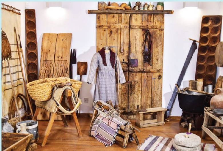
Από το εσωτερικό του Μουσείου Αγροτικής Ζωής